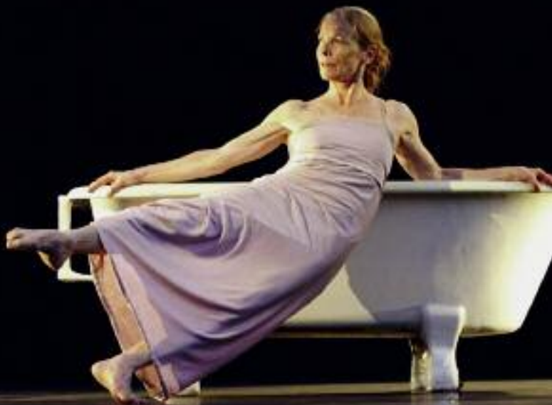
Scapino Ballet Rotterdam „schritt_macher dancepieces“