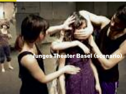
Junges Theater Basel (scenario)