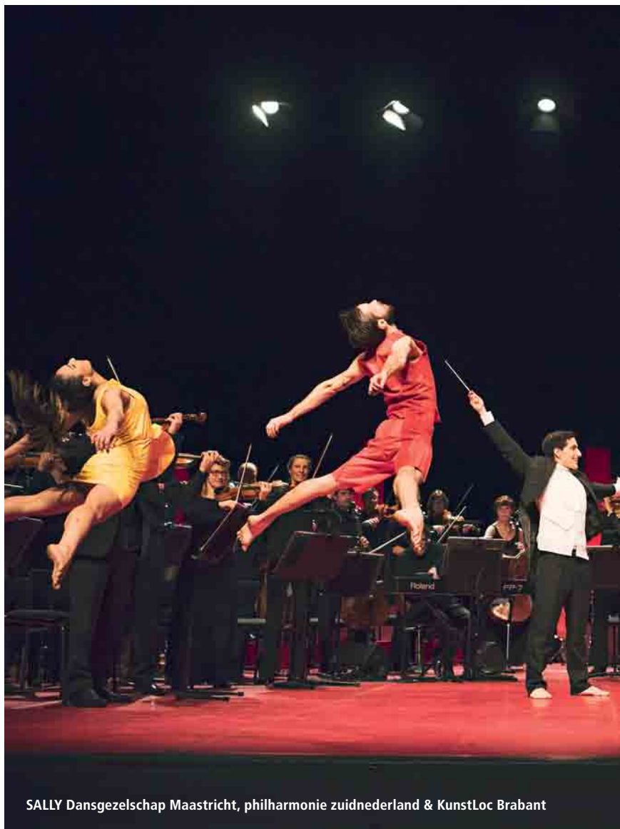
SALLY Dansgezelschap Maastricht, philharmonie zuidnederland & KunstLoc Brabant