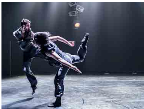
Kibbutz Contemporary Dance Company