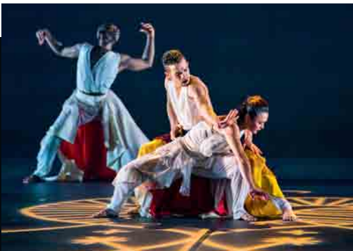
Phoenix Dance Theatre