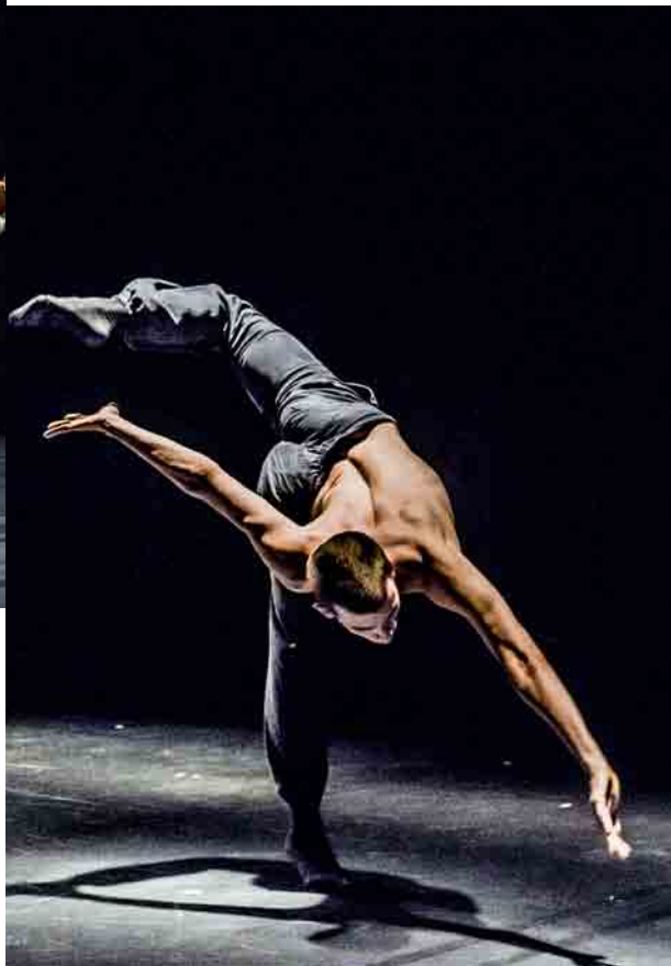
Kibbutz Contemporary Dance Company