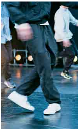
Junge Talente jong talent

Ook dit jaar geeft GENERATION2 jonge choreo- grafen de kans om hun artis- tieke werk te tonen aan ons festivalpubliek. Afgestudeer- den en huidige studenten van verschillende dansscho- len in Duitsland en Neder- land presenteren momenteel hun werk in een selectiepro- ces en de geselecteerde stuk- ken worden in januari 2020 bekendgemaakt.