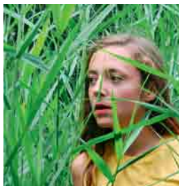
Dadodans / Gaia Gonnelli