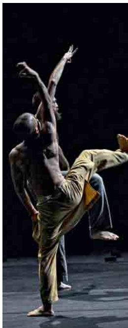
Akram Khan Company