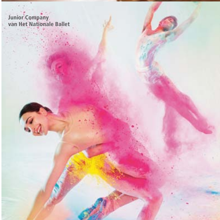
Junior Company van Het Nationale Ballet