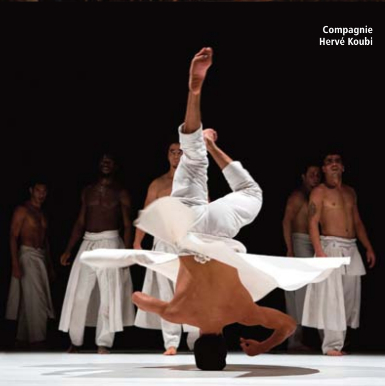
Compagnie Hervé Koubi