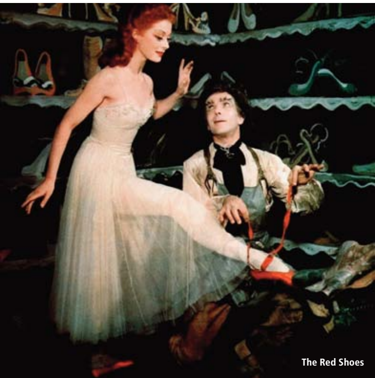
The Red Shoes

„Sevillanas“ (1992), „Flamenco“ (1995), „Tango“ (1998), „Iberia“ (2005) und „Flamenco, Flamenco“ (2010) haben begeistern lassen. Ein fast schon überraschender weiterer Höhepunkt der Reihe, der es wie seine Vorgänger versteht, gerade auch die Nicht-Spezialisten anzurühren und zu verzaubern.