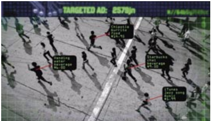
Targeted Advertising SIDEWALK Movies 2.0