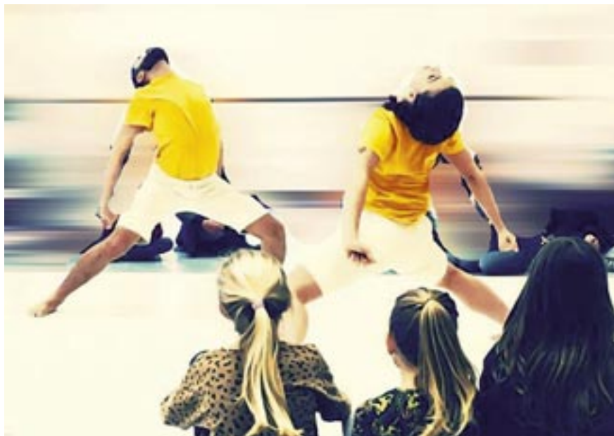
Dit Dat Dans SALLY Dansgezelschap Maastricht

„Dit Dat Dans“ vereint Vorstellung mit Workshop und wendet sich speziell an ein junges Publikum sowie Verwandte. Diese Vorstellung präsentiert eine einzigartige Möglichkeit, Tanz gemeinsam und mit allen Fasern des Körpers zu erleben. Mit der Nase auf der Tanzfläche werden junge Menschen