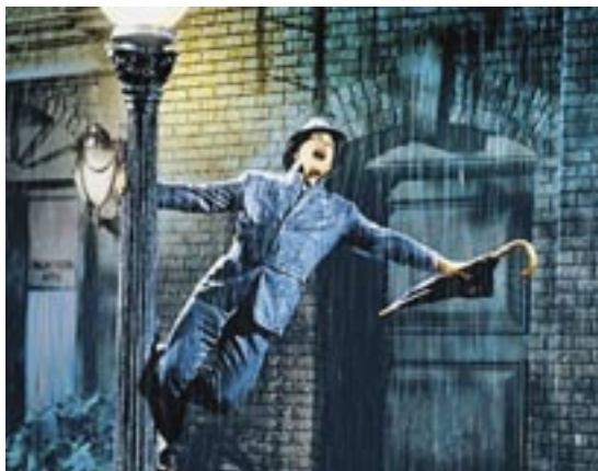
Singin' in the rain

Singin' in the Rain is een Amerikaanse musical/dansfilm uit 1952. Singin' in the Rain draait in grote lijnen om de filmster Don Lockwood, zijn vriend Cosmo Brown en de getalenteerde Kathy Selden. Hun levens worden echter op hun kop gegooid door de grootste historische gebeurtenis in de filmwereld, de overgang naar geluidsfilms.