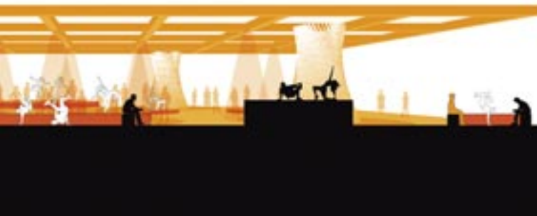
Ballet Mécanique 2.0 Tanzperformance