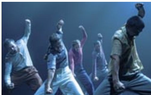
Hofesh Shechter Company

10,00 € Teilnehmergebühr Kosten van deelname Anmeldung aanmelden www.plt.nl T.: +31(0)45-5716607