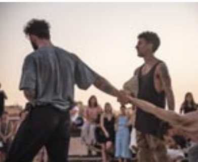
Space Frantics Dance Company

‘Space’ is een werk dat direct in de diepste verhalen van de performers duikt in de midden van een constante stroom van gebeurtenissen. Het publiek is er getuige van hoe alles zich ontrafelt en samensmelt door een unieke, energieke en zachte lichamelijkeheid.