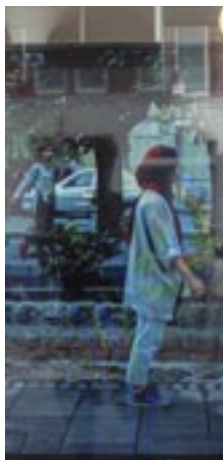
SIDEWALK Mensch und Maschine Mens en machine