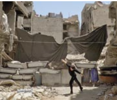
Dance or Die