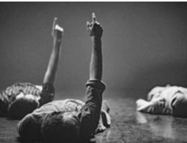
Hofesh Shechter Company

De videoportretten en nagesprekken vormen samen een inhoudelijke omlijsting van de dansvoorstelling. Daags na de voorstelling plaatsen wij ze als minidocumentaire online op onze website, zodat liefhebbers – waar dan ook ter wereld – ze kunnen bekijken. Samen vormen de docu's een levend en alsmaar groeiend archief van schrit_tmacher door de jaren heen.