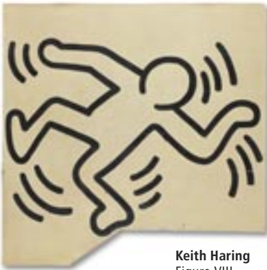
Keith Haring Figure VIII